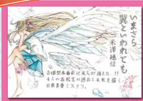
(優秀賞・高校生の部)