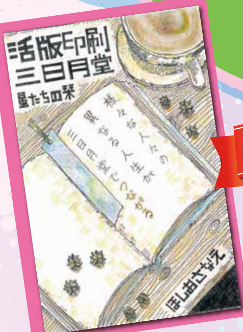
(最優秀賞・高校生の部)