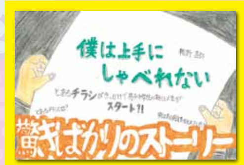
(優秀賞・中学生の部)