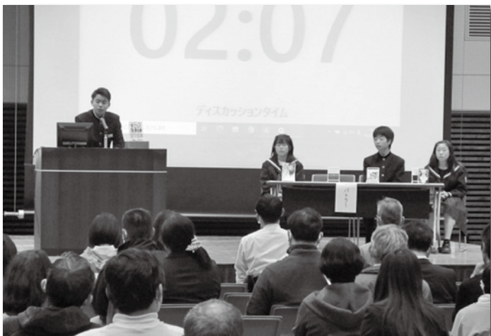
(写真) 令和5年度の決勝の様子 (県立情報交流センター Big・U)