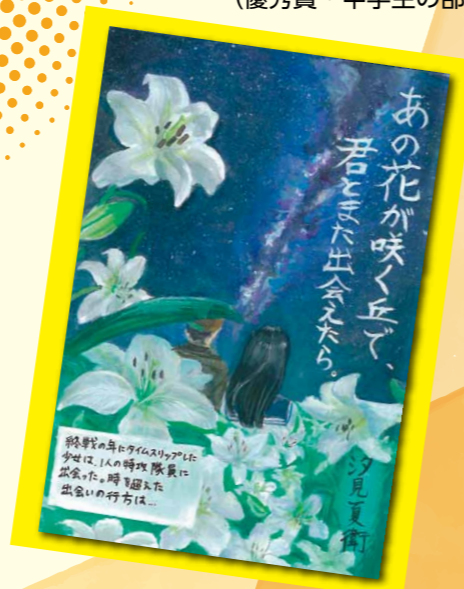
(優秀賞・高校生の部)