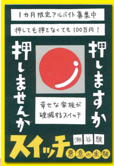
(最優秀賞・高校生の部)