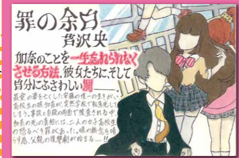
(優秀賞・中学生の部)