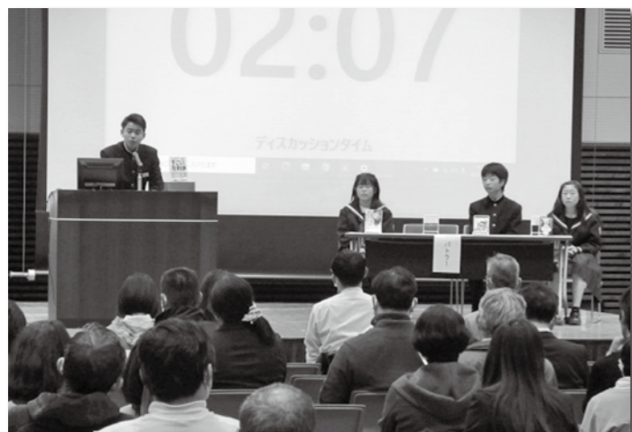
(写真) 令和5年度の決勝の様子 (県立情報交流センター Big・U)