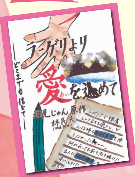
(最優秀賞・中学生の部)