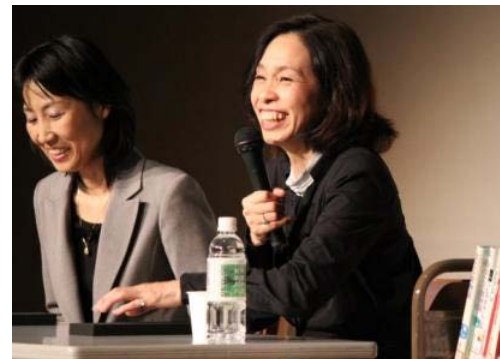
この笑顔！あさのさんのパワーが伝わってきます

舞台上に立たれたあさのさんは、笑顔がとても素敵な女性で、このスリムな身体からたくさん、たくさん人の心を動かす物語が生まれているのかと見とれてしまいました。