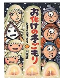
「お化けの冬ごもり」川端誠 BL出版