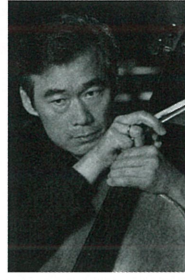
ヤン・ソンウォン (チェロ)

1979年、東京藝術大学大学院修了。「安宅賞」受賞。ロン＝ティボー、ヴィエニャフスキ、ミュンヘンなどの国際コンクールに入賞。イザイメダル、ポルドー音楽祭金メダル受賞などヴァイオリニストとして国際的に活躍。'84年に東京芸大に迎えられるとともに本格的な演奏活動を開始。'89年には、文部省在外研究員としてロンドンの王立音楽院に派遣され、さらに研鑽を重ねた。この時期、アマデウス弦楽四重奏団メンバーとの出会いにより澤クワレットの結成を決意する。ヴィオラ奏者としては、アマデウス弦楽四重奏団メンバーとの共演を始め、グスタフ・マーラーQ、ロータスQ、クスQ、ヘンシェルQらと共演。2004年、和歌山県文化賞受賞。東京芸術大学音楽学部長を経て2016年4月より東京芸術大学学長に就任。英国王立音楽院名誉教授。和歌山県立図書館音楽監督。