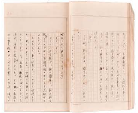
喜多村進『徳川頼貞侯の横顔』原稿 (第2章「頼貞侯の第一印象」) 和歌山県立博物館蔵