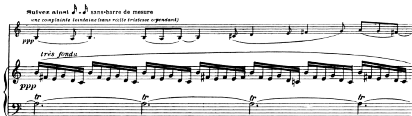
▲ ケクラン《ヴァイオリン・ソナタ》第2楽章より