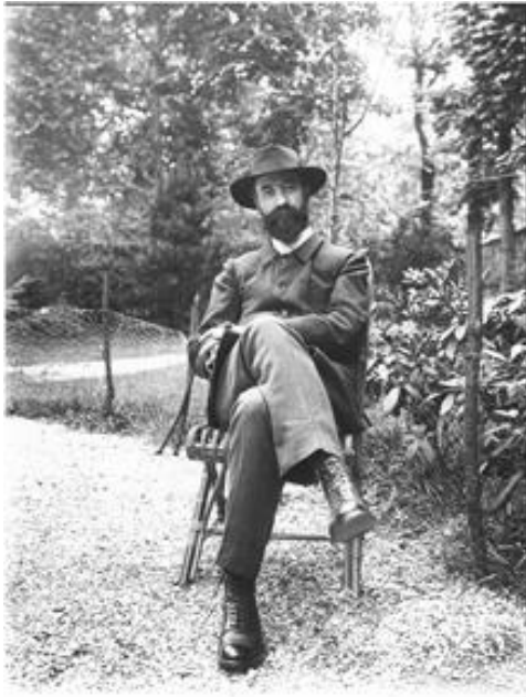
▲ シャルル・ケ克蘭